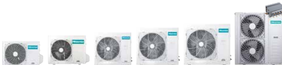
AMW-42U4SE inkl. Verteilerbox F15E

* Abhängig vom Typ der Außeneinheit, AMW-42U4SE Kühlen +7^{\circ}\text{C} , Heizen -10^{\circ}\text{C}